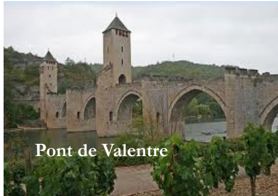
Pont de Valentré