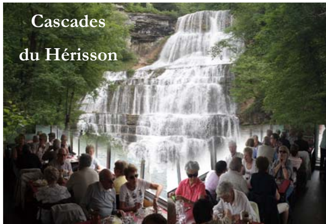
Cascades du Hérisson

Nous sillonnerons la vallée de la Dordogne avec la visite de ce grandiose site naturel : le gouffre de Padirac. Rocamadour village médiéval et cité de pèlerinage qui offre un paysage saisissant du haut de sa falaise. Les jardins du manoir d'Eyrignac qui font partie des plus beaux jardins de France. Le château des Milandes immortalisé par Joséphine Baker.