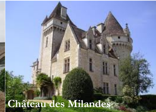
Château des Milandes

Cahors et son célèbre pont Valentré avec croisière sur le Lot et visite de Saint-Cirq-la-Popie élu plus beau village de France pour terminer par: