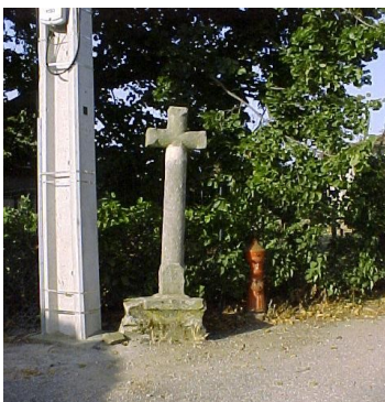
Croix du Champ