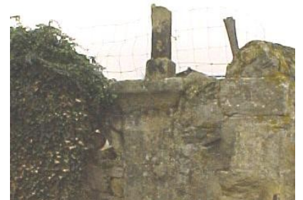
Croix de la Côte

La restauration de la loge « Jean Chaize » est en voie d'achèvement. Maintenant il faut reprendre les croix qui étaient en attente (la Côte et le Champ) .et donner un coup de neuf à l'oratoire de la Salette